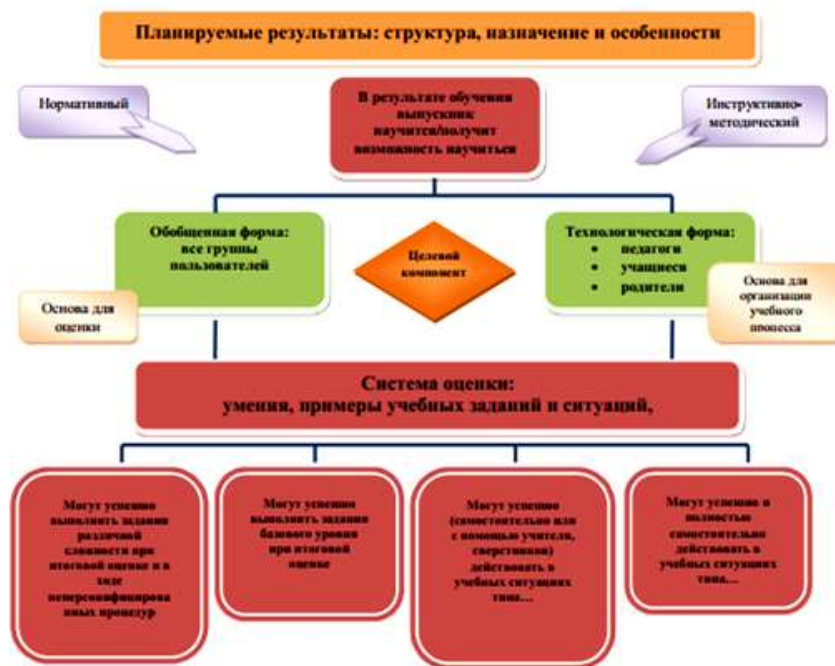
Рис.1. Особенности структуры планируемых результатов. Функция и назначение.

России. Всеобщая история», «Обществознание», «География», «Математика», «Информатика», «Физика», «Биология», «Химия», «Изобразительное искусство», «Музыка», «Технология», «Физическая культура» и «Основы безопасности жизнедеятельности».