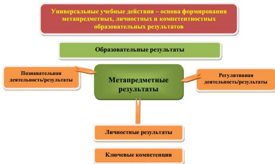
Рис.3. Система оценки планируемых результатов

Система оценки достижения планируемых результатов освоения основной образовательной программы основного общего образования предполагает комплексный подход к оценке результатов образования, позволяющий вести оценку достижения обучающимися всех трёх групп результатов образования: личностных, метапредметных и предметных , а также ключевых компетенций обучающихся .