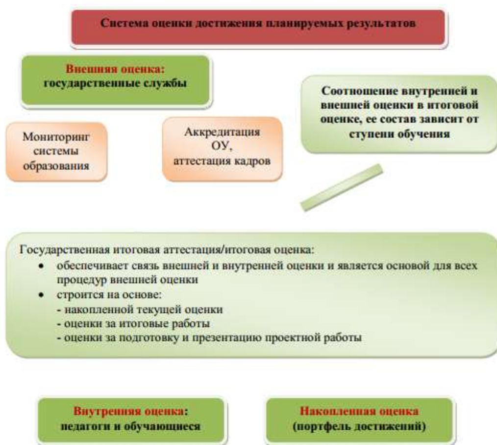
Рис.2. Система оценки достижения планируемых результатов

Итоговая оценка результатов освоения основной образовательной программы основного общего образования определяется по результатам промежуточной и итоговой аттестации обучающихся.